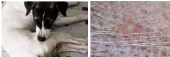
Automutilarea este o manifestare frecventă a pruritului